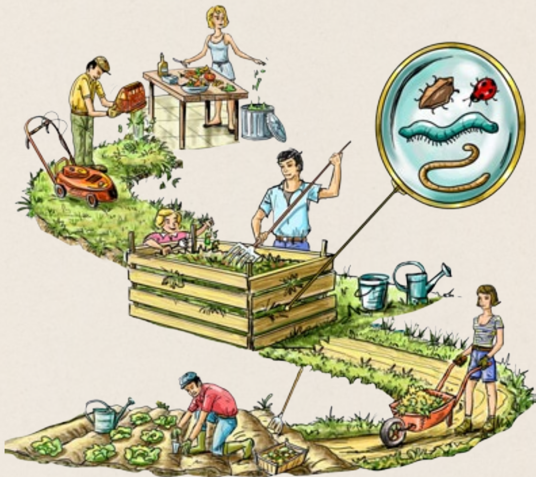
Le cycle du compost