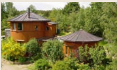
Village écologique de Findhorn (Ecosse)